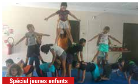
Spécial jeunes enfants

Chaque groupe sera constitué de 16 enfants, deux animateurs et un directeur. Des professionnels diplômés d'Etat encadreront les activités spécifiques.