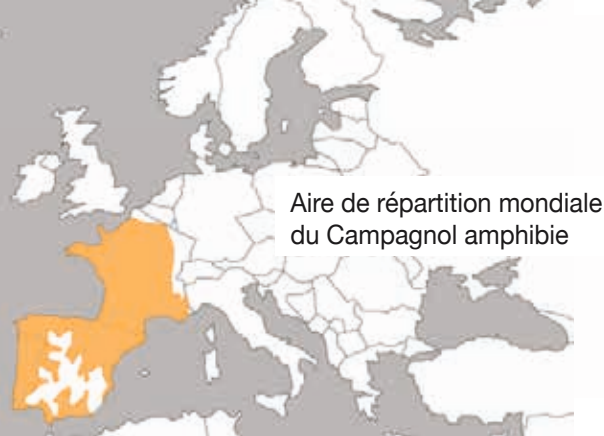
Aire de répartition mondiale du Campagnol amphibie