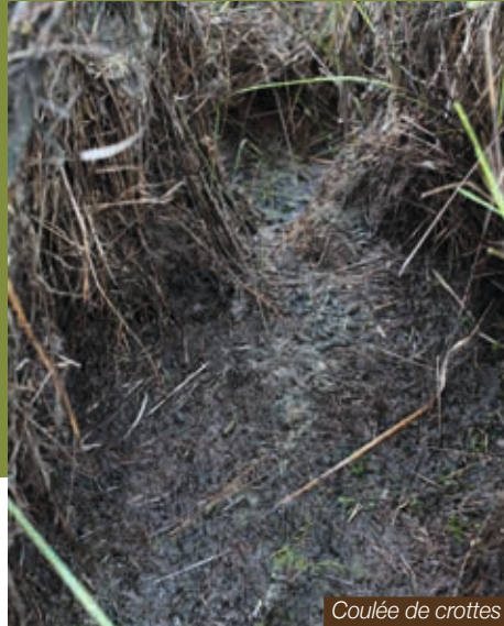
Coulée de crottes

Longueur : 9 à 16 mm | Longueur : 3 à 9 mm Largeur : 3 à 6 mm | Largeur : 1,5 à 2,4 mm