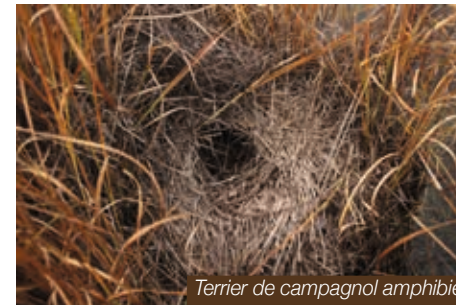
Terrier de campagnol amphibie