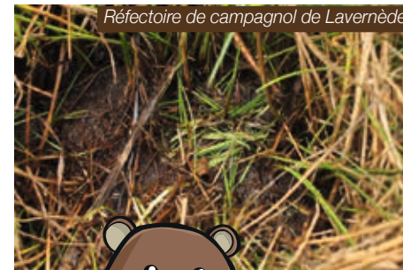
Réfectoire de campagnol de Lavernède

Le Campagnol amphibie occupe une large gamme de zones humides au sein desquelles il sélectionne ses habitats préférés. Il recherche toujours à proximité d'un cours d'eau ou d'un étang, les végétations herbacées hautes et les substrats meubles. La végétation joue un rôle primordial, à la fois de source de nourriture et de refuge face aux prédateurs. Quant au substrat, il doit permettre le creusement de terriers utilisés pour la mise bas et l'élevage des jeunes.