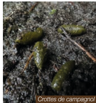
Crottes de campagnol

Le Campagnol amphibie est une espèce farouche qui se laisse rarement observer. Il est plus facile de déceler ses indices de présence, que sont les crottes, les restes de repas, les coulées et terriers. Pour cela, il est nécessaire de fouiller dans les hautes herbes au bord de l'eau.