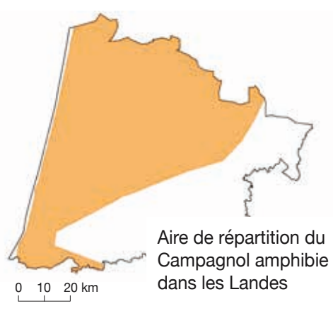
Aire de répartition du Campagnol amphibie dans les Landes