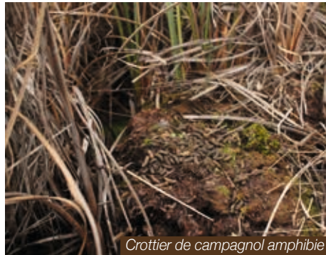
Crottier de campagnol amphibie