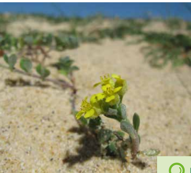
Alysson des sables