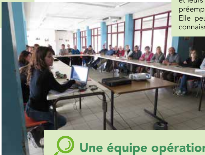
Réunion de concertation

Installée en 2022, la commission Nature 40 est l'instance départementale consultative qui permet de renforcer la gouvernance du Schéma, aux côtés des comités de site. Regroupant collectivités, associations et experts, elle se prononce sur l'opportunité de labellisation de sites du réseau et leurs orientations de gestion, la création de périmètres de préemption, permet aux acteurs de partager leurs stratégies. Elle peut aussi être associée aux actions d'acquisition de connaissance et d'éducation.