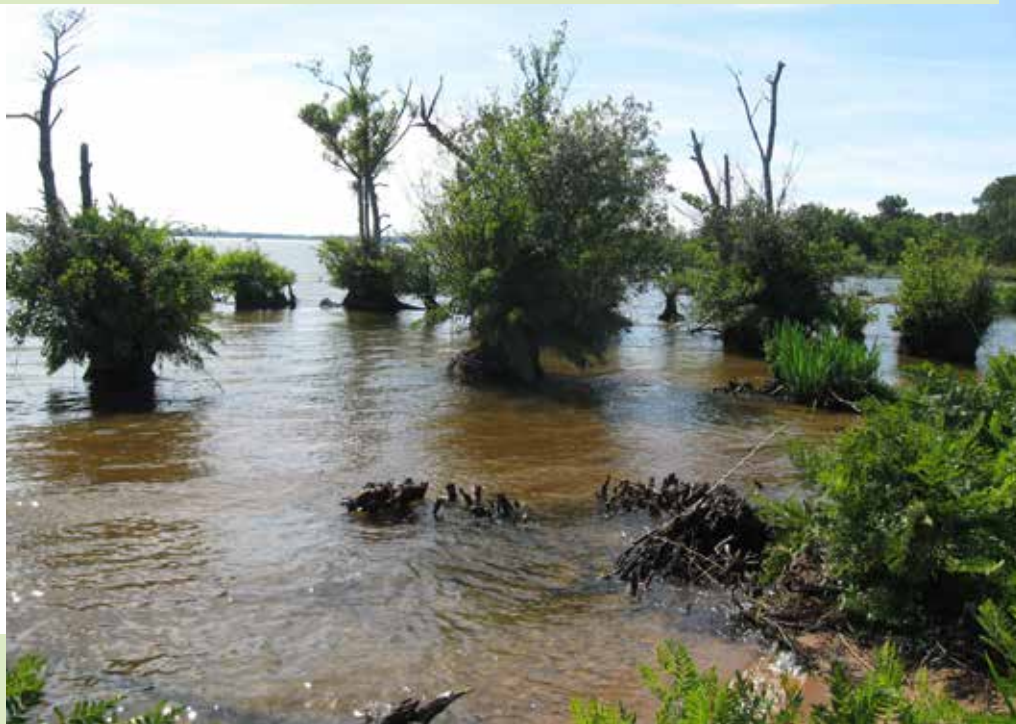
Bordure d'étang littoral

Outil foncier et juridique, la ZPENS est un périmètre instauré par le Département, en lien avec les élus locaux sur un espace naturel identifié à fort enjeu de préservation. Elle permet au Département d'acquérir prioritairement des milieux naturels dans l'objectif de leur préservation et leur ouverture au public. Ce dernier peut déléguer son droit de préemption au Conservatoire du littoral, à une commune ou toute autre structure publique habilitée.